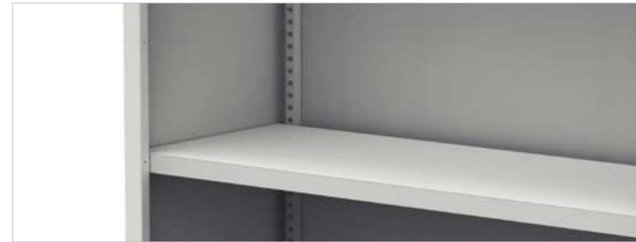
Romp met vouwrand met inkepingen voor de multifunctionele legborden (K01) Corps avec parois latérales repliées et encoches pour tablettes multifonctionnelles (K01) Body with sides equipped with notched bars for multi- functional shelves (K01)