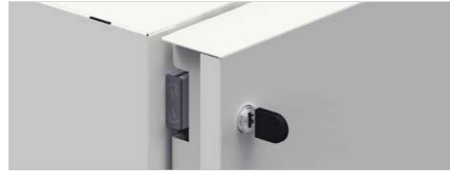
Individueel afsluitbare deuren Portes fermant à clef individuellement Individually lockable doors