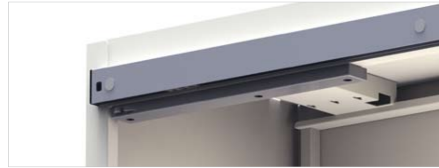
Softclosing (optie) Fermeture avec système d'amortissage (en option) Soft closing (option)