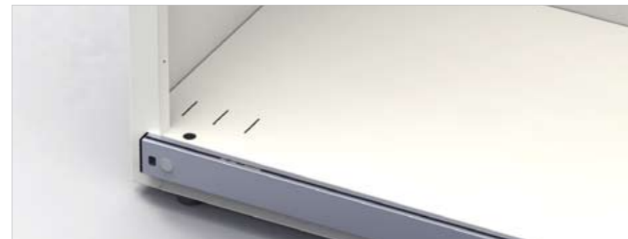
Verhoogde bodem met van binnenuit verstelbare regelvoeten Fond rehaussé avec vérins réglables de l'intérieur With raised bottom and adjustment feet adjustable from inside the cabinet

Met het oog op constante verbeteringen, behouden wij ons het recht voor de techniek en/of kenmerken van onze artikelen te wijzigen, zonder verdere verbintenis van onzentege.